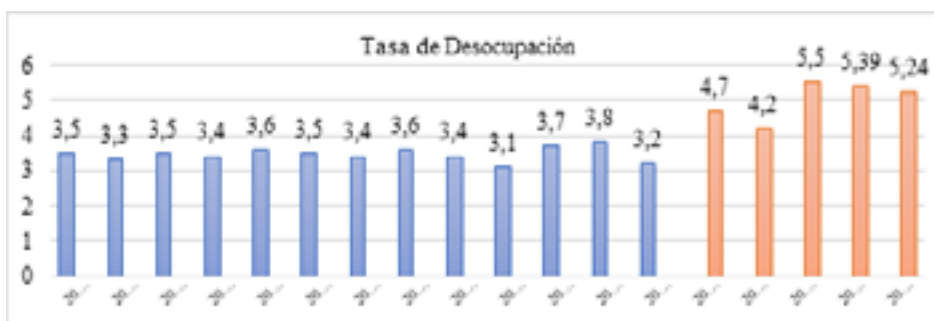
Figura 1 Tasa de desocupación

Tasa de desocupación, datos de abril, mayo y junio 2020 proveniente de la Encuesta Telefónica de Ocupación y Empleo (ENOE), 2020.